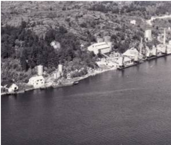
Leidland Sildoljefabrikk 1954.