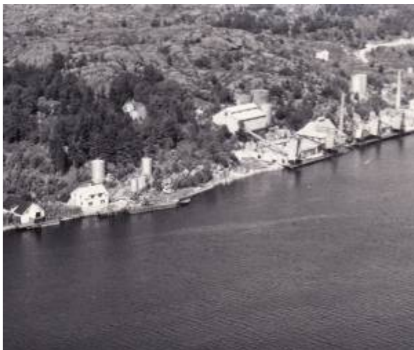
Leidland Sildoljefabrikk 1954.