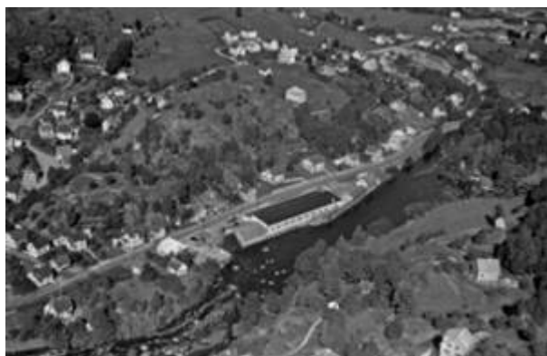
Langaardsfjellet, 1953

Fjell beliggende nord for Hellelandsgaten . Langaard var en innflytter som hadde stykke i området. Langaardsfjellet, og senere Langaards gate , har fått sitt navn etter ham.