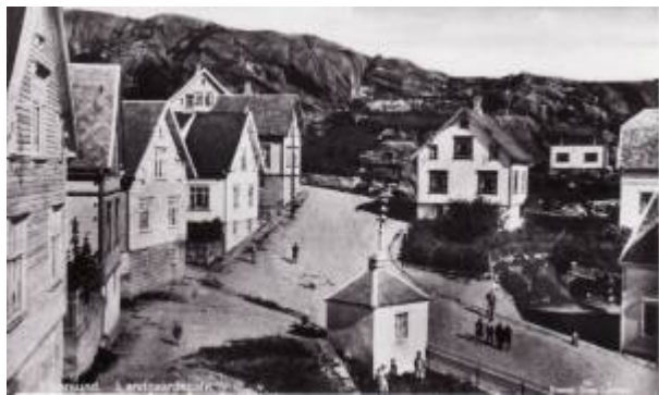
Parti fra Langaards gate.

Gate mellom Nyeveien og Gamleveien , navnsatt i 1905.