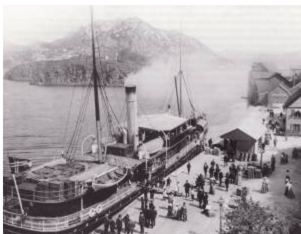
DS Lindholmen ved kai ca 1900.

På det tidspunkt dampskipene kunne begynne å legge til kai i Egersund hadde byen hatt jernbaneforbindelse med Stavanger i lengre tid. Det hadde da blitt svært vanlig at reisende tok toget over Jæren for å unngå den harde strekningen langs Jærkysten. Senere, når Flekkefjordbanen åpnet i 1904, ble denne muligheten forlenget til Flekkefjord.