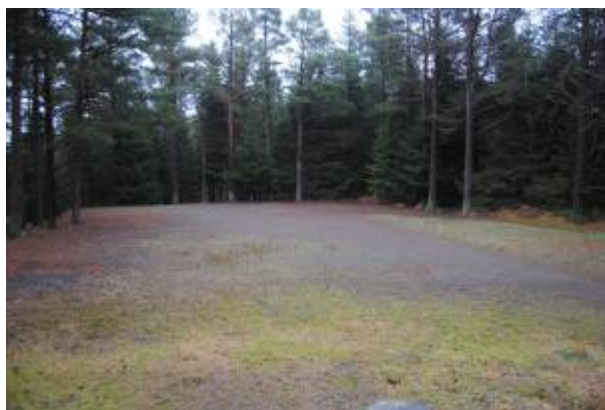
Krokketbanen i Vannbassengene.

I Vannbassengan , på stien som fører mot Årstadfjellet og over til Heggdalsveien, er det en større planert og gruset bane. Den ble opprinnelig anlagt som krokketbane i 1930-åra av ungdom på Mosbekk og i Lunden , men ble utvidet samtidig som den nevnte stien ble opparbeidet og har de siste årene stort sett vært brukt som fotballbane. 1)