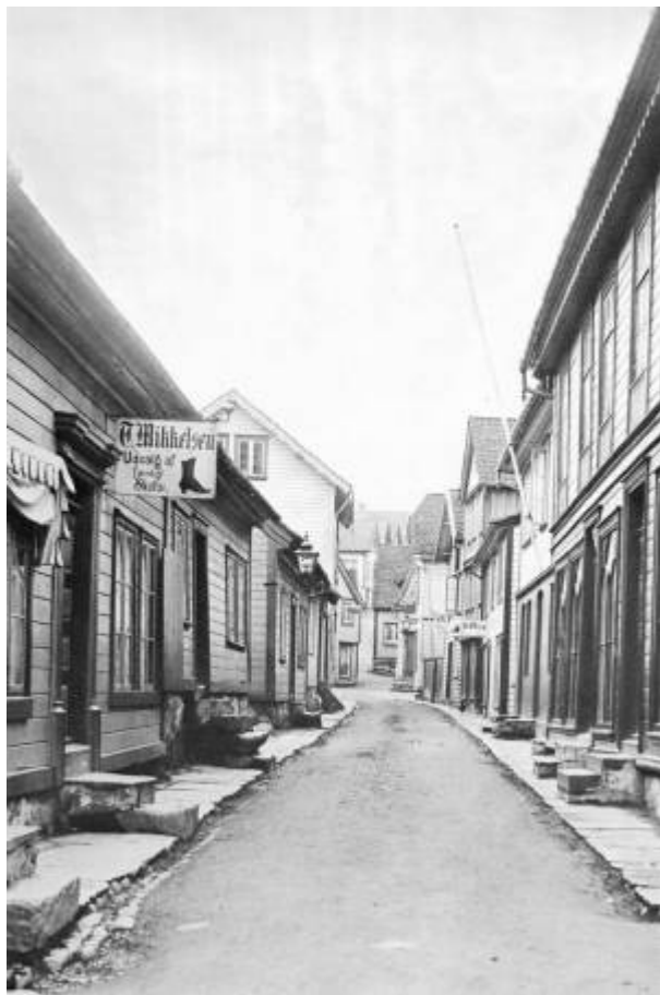
Nedre del av Kirkegaten, Kraksasmauet.

Det folkelige navnet på nedre del av Kirkegaten , der det var flere utsalg av "kraks" (av eng.: cracks = sprekker), 3. sorterings varer fra Egersunds Fayancefabrik . 1)