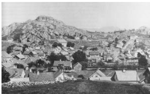
Utsikt mot Kråkefjellet. 1890-åra.

Kråkefjellet er høyeste punkt på Havsøya og ligger nordnordøst for Damsgård. Navnet er av nyere dato.