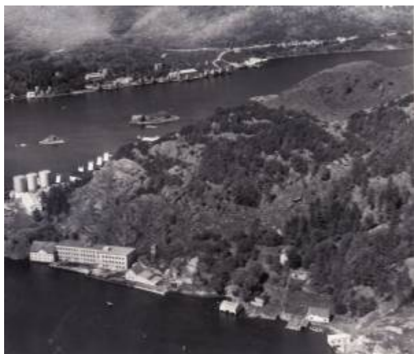
Kontrari, 1956. Foto: Widerøe/DF (Utsnitt)

Kontrari betyr motsatt, midt i mot (byen). Det er et forholdsvis nytt navn på fjellet som i tidligere tider het Fløyfjellet da det «alltid» har stått en fløy her. Selve toppen av Kontrari rager 106 m.o.h., mens fløyen står på et litt lavere punkt.