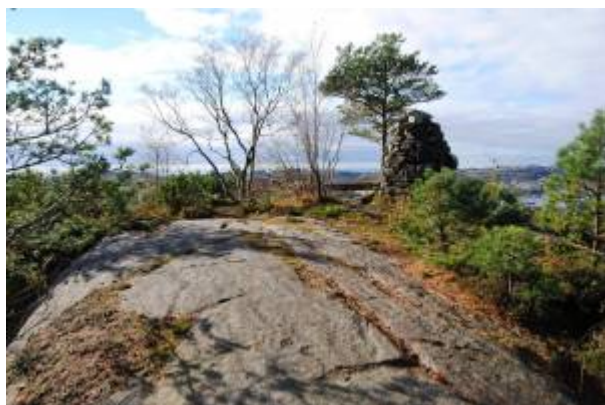
Årstadfjelltoppen, der Kongestolen engang sto.

På Årstadfjelltoppen bygde ungdommer fra Mosbekk og Lunden i 1930-åra en stol av stein som de kalte Kongestolen. Byggverket ble ikke vedlikeholdt, og gikk etter hvert i stykker. Varden som i dag står på Årstadfjelltoppen er hovedsakelig bygd av steinene som disse ungdommene engang bar opp på toppen. 1)