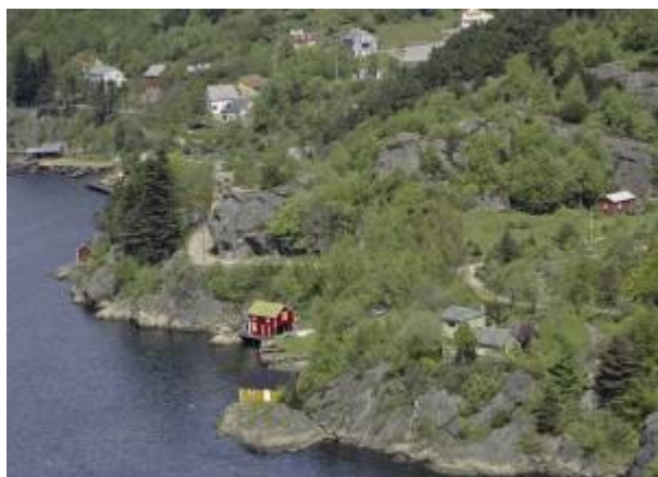
Fra Bruvikområdet 1961. Det er ikke kjent hvor i Bruvik kirkegården lå.

Kolera er en smittsom sykdom med stor dødelighet. Den opptrer endemisk, eller innenfor begrensede områder flere steder i Asia. Til Europa kom sykdommen som epidemi i 1817 - 1822 og det har siden vært flere koleraepidemier her.