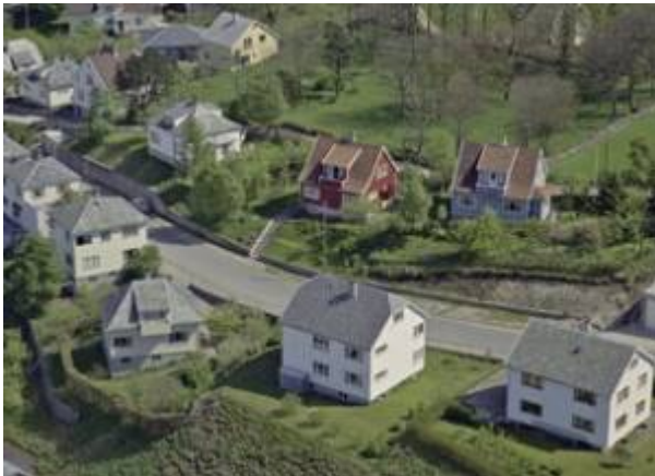
Kjeld Bugges gate, 1961.

Gate mellom Aarstadgaten og Prestegårdsveien, navnsatt i 1905.