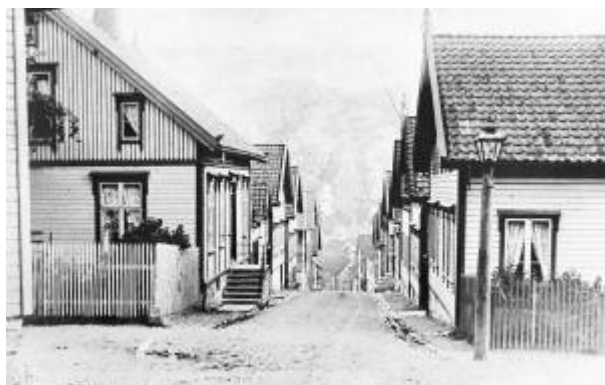
Kirkegaten, øvre del, i 1890-åra.

Gate mellom Torget og Aarstadgaten , navnsatt i 1905.