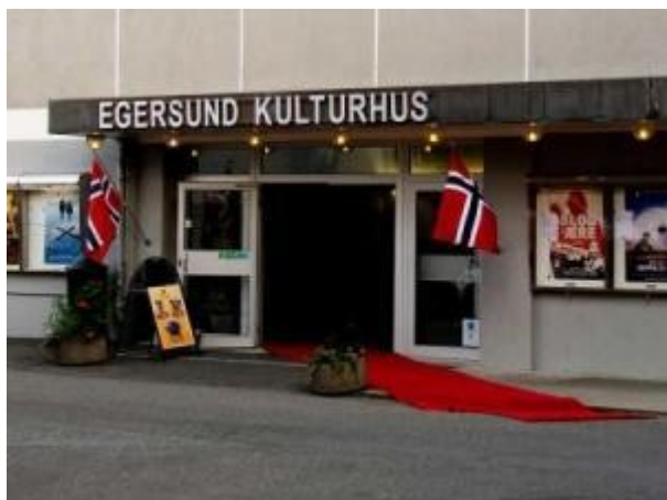
Egersund kulturhus.

Byen hadde med dette fått en ny storstue med sitteplass til 380 personer i myke stoler på skrånende golv. Bygget hadde dessuten klimaanlegg. Det tekniske utstyret var av det beste som kunne skaffes, og kinolerretet var hele 9 meter bredt slik at filmer i det nye formatet «Cinemascope» kunne vises. Det var mange som mente at byen hadde fått landets vakreste kino!