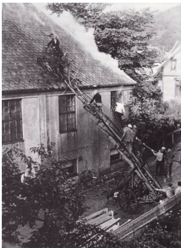
Festiviteten brenner 9. juli 1941.

Det viste seg imidlertid vanskelig å få til en kino i kommunal regi. Selv om Arbeiderpartiet lokket med gunstige leietilbud i byens nyeste og flotteste forsamlingslokale holdt de fleste politikerne igjen. De ville ikke bruke skattebetalernes penger på kinounderholdning. Andre igjen mente at kinoen brøt «med folks sedelige og moralske prinsipper».