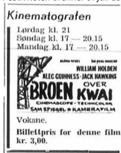
Annonse i Dalane Tidende 20.02.1959