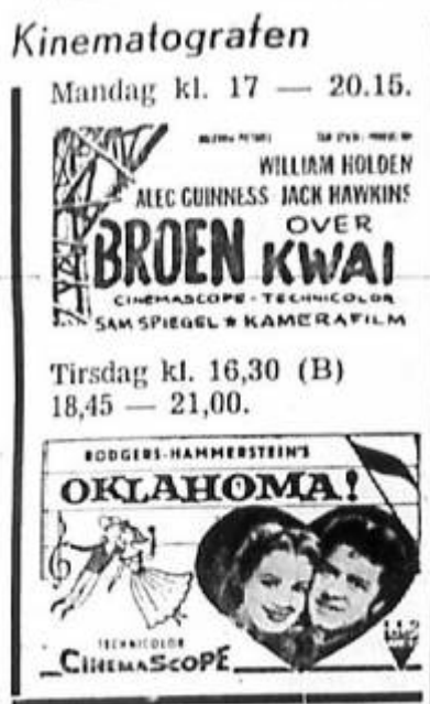
Annonsen i Dalane Tidende 23.02.1959

Men folk ønsket kino. I 1921 var det slutt på Arbeiderpartiets tålmodighet, og partiet lot prinsippene falle. På slutten av året stiftet flere partimedlemmer Egersunds Selskabelige Forening, hvis formål var å vise film i Folkets hus - Festiviteten i Sandakergaten 6. Offentlige konsesjonsvilkår ble unngått ved at man måtte være betalende medlem i foreningen for å kunne delta på «møtene», dvs. filmframvisningene. Det første «møte» ble holdt 17. februar 1922, og den svenske filmen «Körkarlen» sto på programmet. Den lukkede foreningen ble en stor suksess fra første dag, og allerede etter få dager hadde den fått over 500 medlemmer. Men medlemskapet var ikke mer eksklusivt enn at det kunne tegnes av hvem som helst sammen med kjøp av billetten.