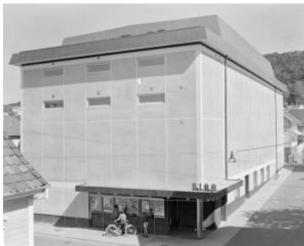
Egersund kino ca. 1959.

I store deler av byggeperioden fungerte Godtemplarlokalet som kino.