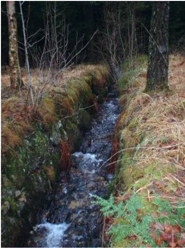
Kanalen mot 1. Vannbasseng.

En del av det opprinnelige anlegget til Egersund vannverk ved Vannbassengan . For å lede vann fra Tveidatjødne , Kjerketjødne og Sandtjødne til Inntaksbassenget ble det bygd steinsatte kanaler. Samlet lengde av disse var ca 950 meter.