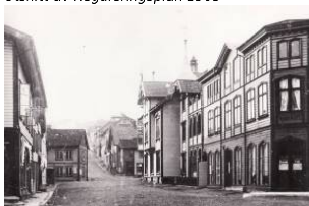
Johan Feyers gate, 1897.

Gata ble regulert som Branngate i Reguleringsplan 1858 , og gikk da helt til bygrensa. På plankartet er den benevnt Alminding II . På bildet fra 1890-åra er den fortsatt ikke helt gjennomført som branngate, men i 1905 var den opparbeidet etter reguleringsplanen og hadde bebyggelse på begge sider på strekningen mellom Torget og Årstadgaten. I Reguleringsplan 1905 ble den regulert fram til Gamle Prestegårdsvei .