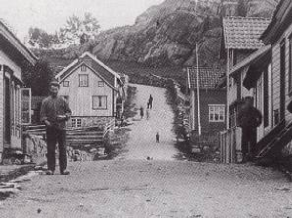
Gamleveien. Svingen og bakken i bakgrunnen kaltes Jerv.

Folkelig navn for den øverste del av Gamleveien, der «Ola Jerv» hadde stykke på Nordavindsfjellet . Kallenavnet fikk han fordi han var flink til å fange jerv. 1)