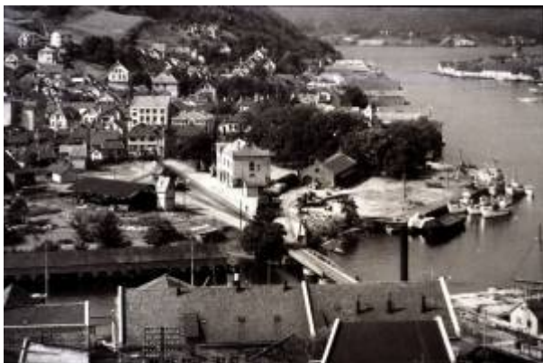
Stasjonsområdet i 1930-åra.

Da det ble klart at Sørlandsbanens gjennomføring ville bety at jernbanestasjonen måtte flyttes til Eie , så byens myndigheter store muligheter for å utvide sentrumsarealet betydelig, og i 1939 ble det satt i gang arbeid med Regulering av stasjonsområdet , en planleggingsprosess som skulle vare helt til 1967 før den kunne ansees som ferdig.