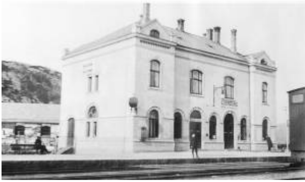
Stasjonsbygningen i 1912.

Den sørlige endestasjonen på Jærbanen ble lagt på Arenes ved Egersund sentrum. Eiendommen ble innkjøpt for 7 000 spesidaler.