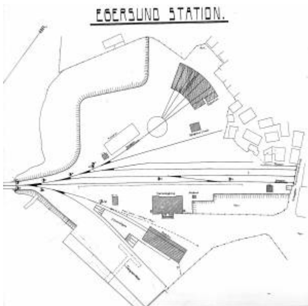
Plan over det nye stasjonsområdet i sentrum.

Hovedbygningen på gården, Nesgård , ble tatt i bruk som stasjonsbygning. Ikke fordi det var spesielt hensiktsmessig, men fordi det sparte statsbanene for å bygge en ny stasjonsbygning. Ellers ble stasjonen opparbeidet med pakk- og godshus, et pakkhus med plattform, svingskive, lokomotivstall med smie og vanntårn som fikk sin forsyning fra Egersund vannverk . På kaien ble det reist en svingkran.