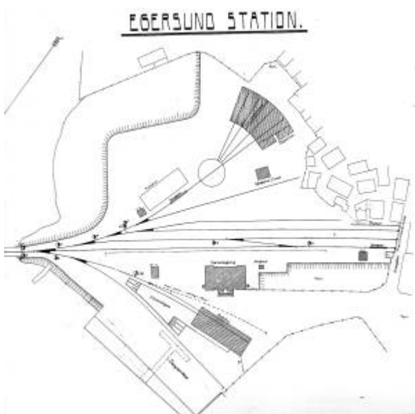
Plan over det nye stasjonsområdet i sentrum.

Hovedbygningen på gården, Nesgård , ble tatt i bruk som stasjonsbygning. Ikke fordi det var spesielt hensiktsmessig, men fordi det sparte statsbanene for å bygge en ny stasjonsbygning. Ellers ble stasjonen opparbeidet med pakk- og godshus, et pakkehus med plattform, svingskive, lokomotivstall med smie og vanntårn som fikk sin forsyning fra Egersund vannverk . På kaien ble det reist en svingkran.