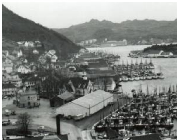
Ingen jernbanevogner eller lastebåter ved Jernbanekaien i 1960.

Kaien mellom Jernbanebrua og Steinbrygga ble bygd da driften av Jernbanestasjonen i sentrum opphørte i 1952. Det ble også lagt et havnespor mellom jernbanestasjonen på Eie og Jernbanekaien. På Jernbanekaien ble det også oppført et havnelager i 1959. Havnesporet ble brukt til midten av 1980-tallet mens havnelageret ble revet i 1989. 1)