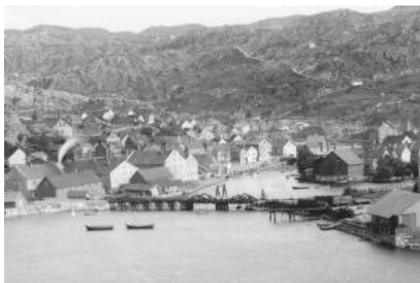
Den første jernbanebrua over Lundeåne, ca. 1880. Foto: E. H. Torjusen/DF (Utsnitt)

Bru på Jærbanen over Lundeånas utløp, mellom Havsøya og Arenes . Den hadde lav høyde over Lundeåne, og for at båter skulle komme til ved fayansefabrikkens kai mot Lundeåne var halvdelen nærmest Arenes bygd som ei svingbru som kunne åpnes. Den første brua ble bygd i tre, men det gikk ikke lenge før den måtte erstattes med ei mer solid stålbru.