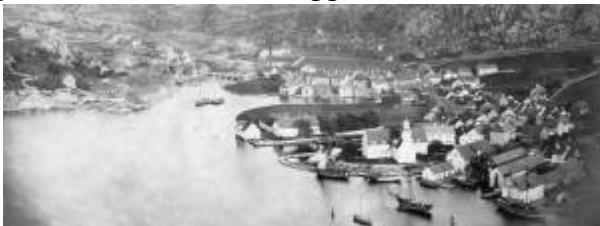
Egersund cirka 1870