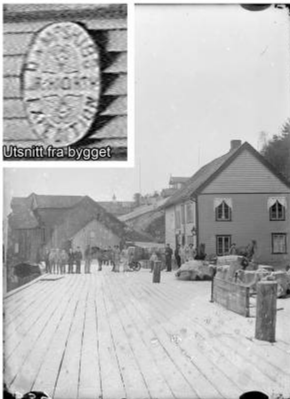
J. Hiorth Dampskibs Expedition rundt 1900. I øvre venstre hjørne er et utsnitt fra veggen på ekspedisjonens forside, som viser et skilt med logoen til dampskipsekspedisjonen.