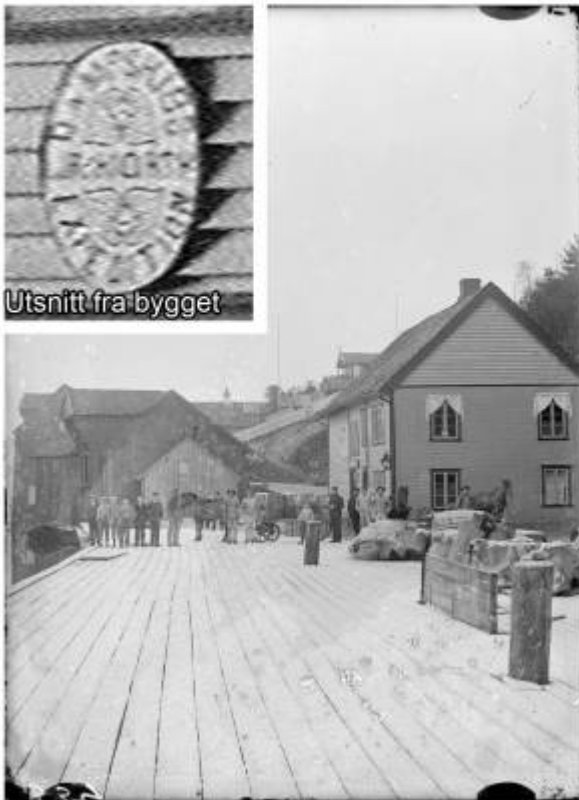
J. Hiorth Dampskibs Expedition rundt 1900. I øvre venstre hjørne er et utsnitt fra veggen på ekspedisjonens forside, som viser et skilt med logoen til dampskipsekspedisjonen.