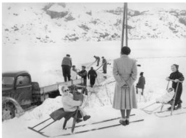
Isskjæring på Slettebøvannet.

Da silda vendte tilbake til farvannene rundt Egersund etter 1910 var det innenlandske markedet beskjedent. I utlandet, særlig i England og Tyskland, var imidlertid etterspørselen etter både fersk og saltet sild stor. Raske dampskip og effektive jernbaner medvirket dessuten til at ferskfisken nådde fram til stadig nye markeder.