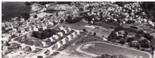
Husabø-området under utbygging, 1956.

Husabø og Årstad var de sentrale gårdene i det som skulle ble Egersund. Det er godt mulig at de opprinnelig har vært en gård, men da så tidlig som før vikingtiden (800 - 1050) og med et annet navn enn dagens. I Egersund er det helleristninger på Husabø, noe som kan tyde på at det i området her kan ha vært samlingsplasser for religiøse markeringer og festligheter. 1)