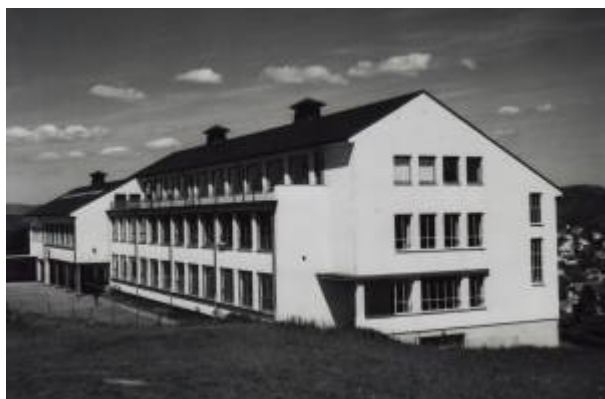
Husabø skole, 1958.

Da de store barnekullene i etterkrigstiden begynte på skolen var kapasiteten i Folkeskolebygningen allerede sprengt, og det ble gitt undervisning på ulike steder i byen. Først i 1958, da den nye Husabø skole ble tatt i bruk, fikk byen en "god og tidsmessig skole".