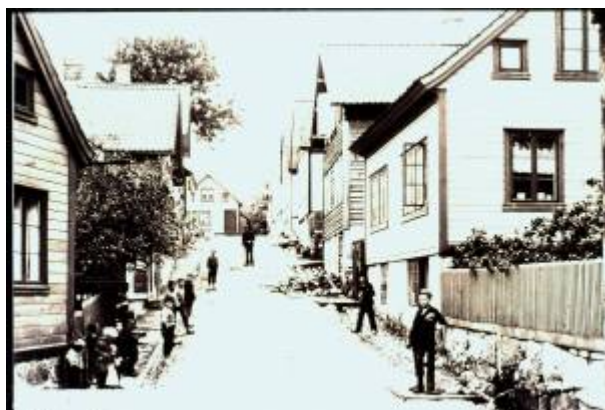
Humlestadgaten i 1890-åra.

Gate fra Gamleveien og sørvestover, i retning bydelen Humlestad , navnsatt i 1935.