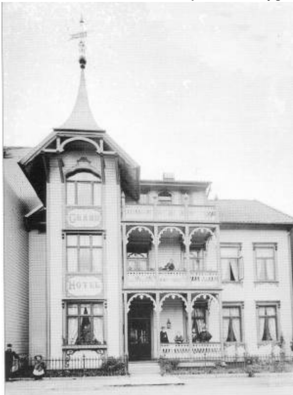
Etter brannen i 1896 ble det bygd nytt hotell på tomten til Hotel Jæderen. Det nye hotellet fikk navnet Grand Hotel.