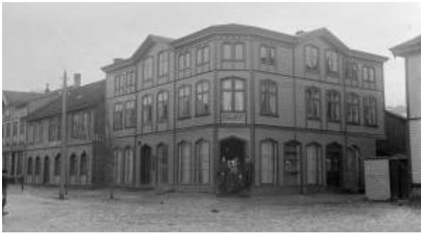
Hotel Carl midt i bildet, Hotel Jæderen i bygningen til venstre. Cirka 1895.