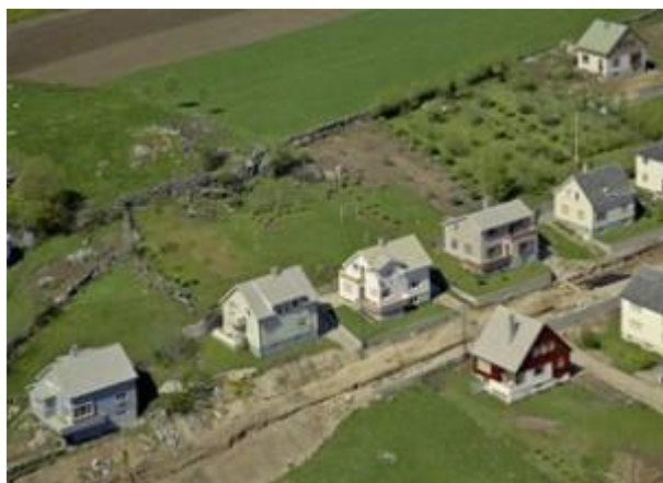
Høgevollsveien under opparbeidelse i 1961.

Veg mellom Gamleveien og Eigersundsveien, navnsatt i 1905.