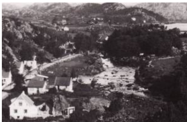
Nyeveien ca 1930. Hausen sees midt på bildet.

Før terrenget mellom Nyeveien og Lundeåne , sørvest for Elverhøy , ble utfyllt var det en markert liten bergknatt langs elvebredden. Denne ble kalt Hausen – som betyr nettopp liten bergknatt 1) 2) .