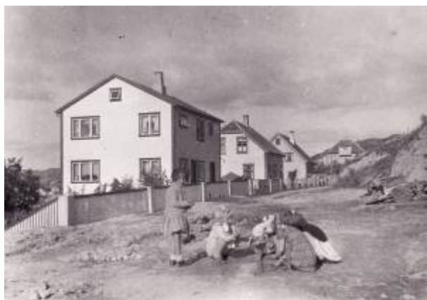
Hammers gate rundt 1938.

Gate på Strandabakken som går fra krysset Johan Feyers gate/Aarstadgaten og vestover.