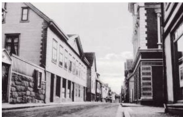
Hammergården.