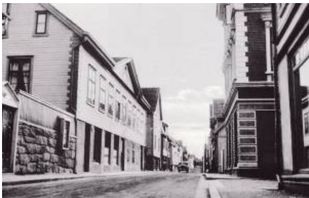
Hammergården.