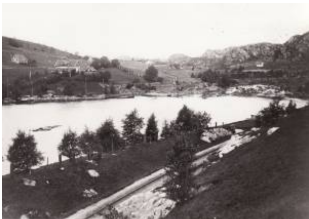
Hafsøystronne 1918.