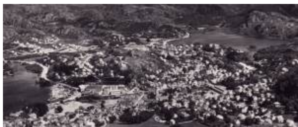
Havsøya, 1956. Foto: Widerøe/DF (Utsnitt)

(også kalt Hafsøy, Hafsøya, se Hafsøy ) Øy som dannes av to elveløp som har sitt utspring i Slettebøvatnet, Eieåne og Lundeåne , og som renner ut i Vågen . Navnet er avledet av det gammelnorske mannsnavnet Hafr, som er det samme som fellesnavnet hafr: bukk (vi finner det samme i bl.a. Hafrsfjord). På Havsøya (Høgevollen) ble det i 1995 gravd ut to langhustuffer som kan dateres til 400 – 500 e.Kr. 1)