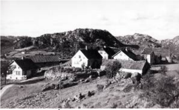
Klyngetunet på Hafsøy.

Den opprinnelige gården på Havsøya . I gammel tid var det vanlig at når en gård ble delt, bygde eieren av det fradelte bruket seg hus tett opp til det gamle gårdstunet. Slik oppsto det etter hvert et klyngetun.