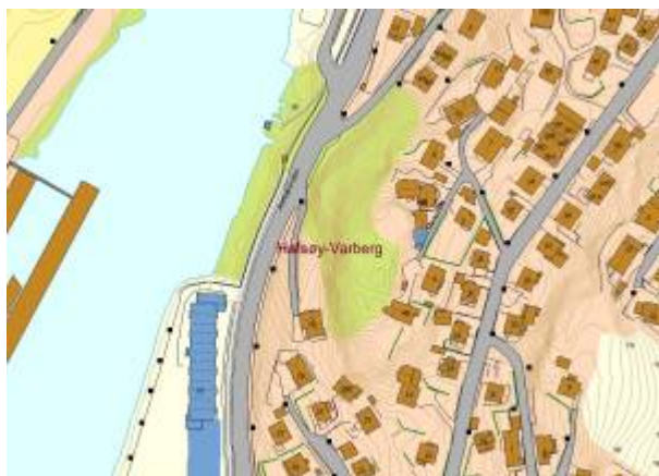
Kart: Eigersund kommunes kartløsning

Fjellknaus på Hafsøy, beliggende mellom Hafsøyveien og Jernbaneveien .