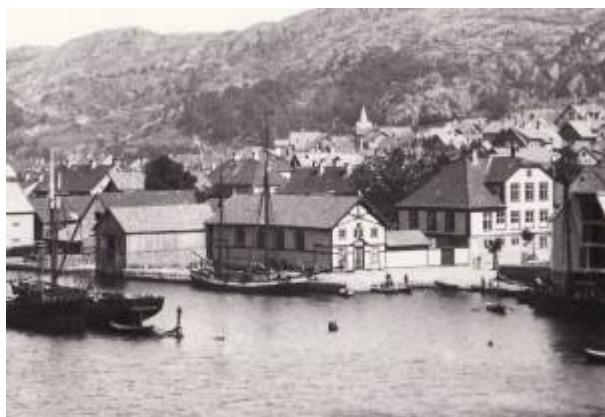
Gymnastikklokalet ca 1890. (Utsnitt)