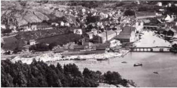
Gruset under utfylling, ca 1920.

Området mellom Jernbaneveien og Vågen som i dag (2011) brukes som drosjeholdeplass, rutebilstasjon og parkeringsplass.