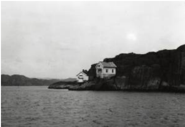
Grunnesundholmen fyrstasjon, 1963.

Grunnesundholmen fyr er et innseilingsfyr som skulle "veilede Fartøier gjennom Løbet vestenom og nordenom Egerøen og til Ankerpladsen ved Horsholmen", som det het i fyrlisten.