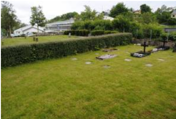
Gravplassen ved Husabøveien. Det almindelige Samfunds del nærmest.

Ved Husabøveien, i krysset med gangvegen som fører til Fjellstedveien, er det en mindre gravplass. Denne tilhører menighetene Samfundet (den søndre delen) og Det Almindelige Samfund (den nordre delen). Samfundets gravplass ble tatt i bruk i 1897, mens Det Almindelige Samfund etablerte sin plass etter splittelsen i 1901. Samfundets del ble benyttet fram til 1924, da menighetens kirkegård på Årstad ble tatt i bruk. På Det Almindelige Samfunds del var den siste begravelsen i 1932.