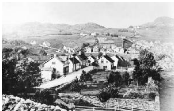
Gravplassen ved Gamleveien i 1890-åra.