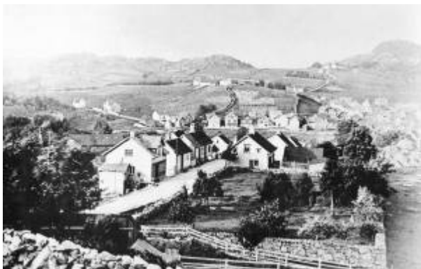
Gravplassen ved Gamleveien i 1890-åra.