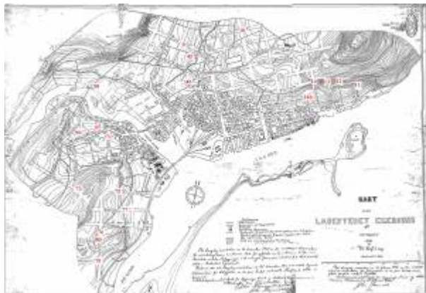
Reguleringsplan 1905 med gater som ikke ble bygd.

Alle gatene som var regulert i Reguleringsplan 1905 , 81 til sammen, fikk navn i 1905. 19 av dem ble imidlertid aldri bygd. 1) Disse var (tallet i parentes etter gatenavnet er kartreferanse og henviser også til gatens nummer i reguleringskommisjonens forslag):