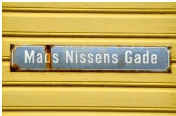
Originalt gatenavnskilt fra 1906: Mads Nissens Gade .

Bystyret vedtok formannskapets innstilling med 7 endringer. Dermed hadde byens veger, gater og plasser fått offisielle navn.