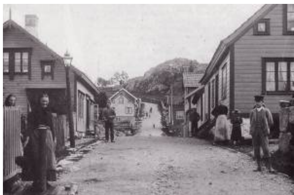
Gamleveien i 1890-åra.

Veg mellom Damsgårdsbrua og Dalaneveien, navnsatt i 1905.