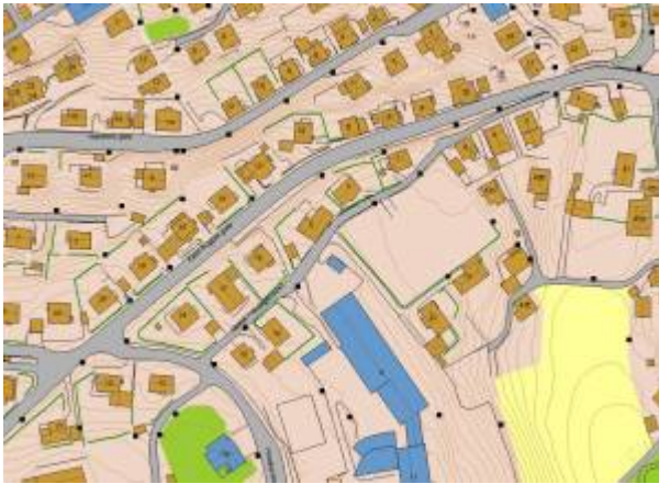
Kart: Eigersund kommunes kartløsning

Veg som går parallelt med Kjeld Bugges gate , mellom dennes kryss med henholdsvis Kjeldebakken og Øvre Prestegårdsvei, navnsatt i 1969.