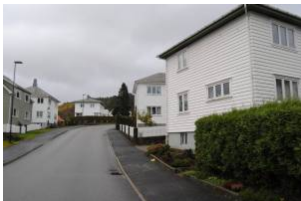
Funksjonalistiske boliger i Aurgrua.

Funksjonalismen 1) er en stilretning der det tas fullstendig avstand fra det dekorative element og utelukker alt som er overflødig. Den rene formen er det eneste av betydning, og form skal følge funksjon. Stilen preges av et forenklet formspråk med store flater, rette linjer og geometriske former. Den har et klart sosialt sikte, i samsvar med samfunnsutviklingen på 1930-tallet for øvrig: man ville skape en arkitektur for de brede lag av folket, med boligbygging og enkel hjeminnredning som utgangspunkt. Et ønske om lys, luft og hygiene var også framtreddende.