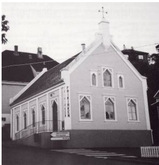
Frikirken 1996.

Utover i 1880-åra gikk det en omfattende vekkelsesbølge over distriktet. På Eigerøy og Hellvik toppet den seg i 1887. Resultatet var at i 1888 meldte 10 personer seg ut av statskirken og dannet Den Evangelisk Lutherske Frikirke i Egersund.