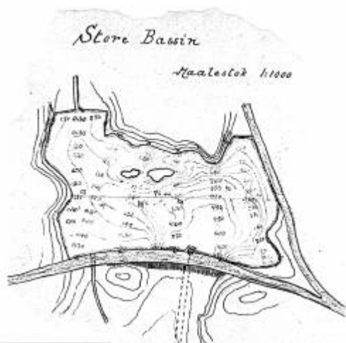
Plan for utbygging av 1. vannbasseng. Eigersund kommunes arkiv