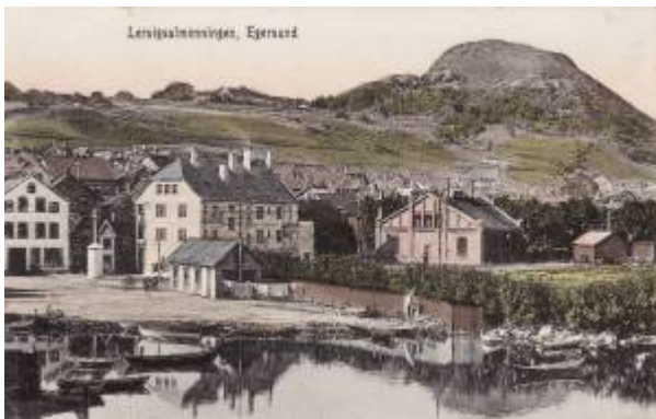
Lervika ca 1910. Nybygget til Fremskridt til venstre for midten av bildet.

Forbruksforeningene er åpne sammenslutninger av forbrukere som har til formål å bedre sine medlemmenes økonomiske og sosiale kår. I Egersund har det vært tre forbruksforeninger: Eikunda , Fram og Fremskridt .