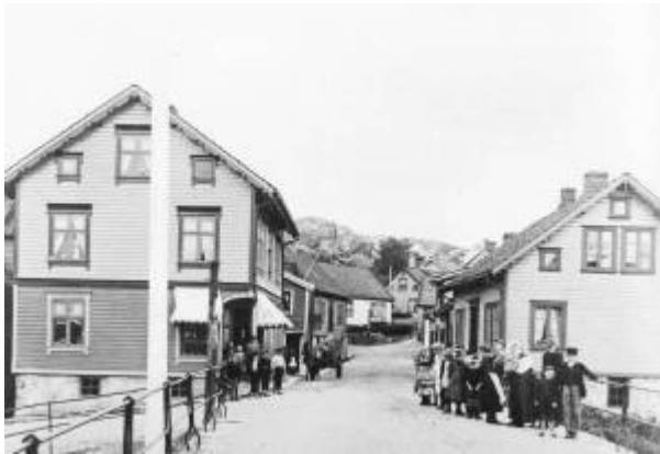
Forbruksforeningen Fram hadde utsalg i huset til venstre i bildet.

Forbruksforeningene er åpne sammenslutninger av forbrukere som har til formål å bedre sine medlemmenes økonomiske og sosiale kår. I Egersund har det vært tre forbruksforeninger: Eikunda , Fram og Fremskridt .