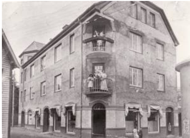
Bygget i Lervika der Eikunda startet forretning i 1925.

Forbruksforeningene er åpne sammenslutninger av forbrukere som har til formål å bedre sine medlemmenes økonomiske og sosiale kår. I Egersund har det vært tre forbruksforeninger: Eikunda , Fram og Fremskritt .