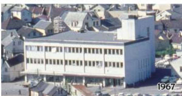
Bygging av Sentrumsgården trinn for trinn.

Etter krigen ble det i flere år arbeidet med planer for et nybygg, men først i 1965 kunne forretningen flyttes over i et første byggetrinn av et nytt varehus som hadde blitt reist på Nytorget , ved siden av bygningen i Jernbanegaten 8. Høsten 1966 ble den gamle bygningen revet og andre byggetrinn av varehuset påbegynt. 28. oktober 1968 kunne så endelig Eikunda åpne et topp moderne varehus sentralt i byen. Bygningen er i dag kjent som Sentrumsgården.