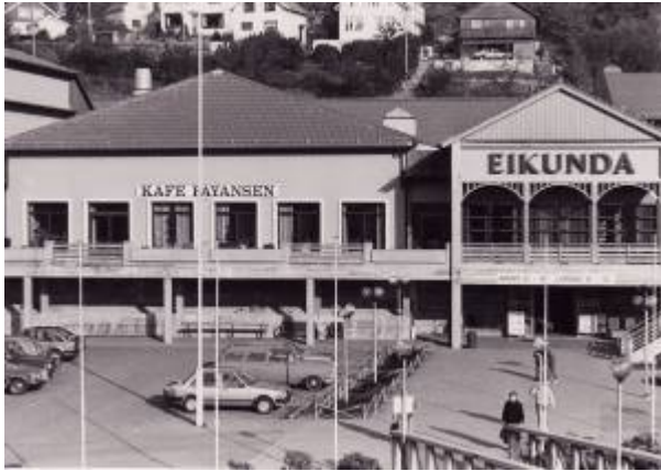
Eikunda 1986.

Eigerøy ble avviklet i 1983 mens filialen på Eie var i drift ut januar 1985.