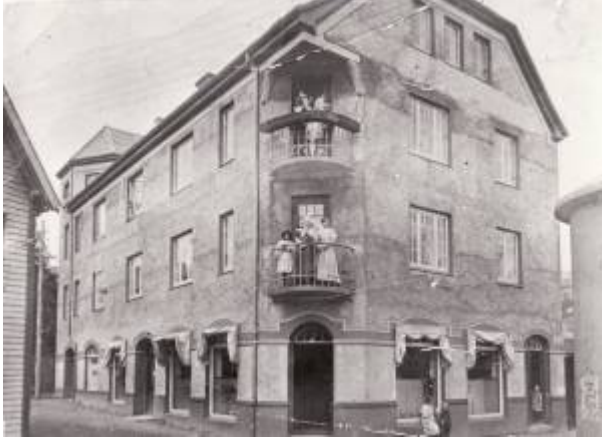
Bygget i Lervika der Eikunda startet forretning i 1925.

Forbruksforeningene er åpne sammenslutninger av forbrukere som har til formål å bedre sine medlemmenes økonomiske og sosiale kår. I Egersund har det vært tre forbruksforeninger: Eikunda , Fram og Fremskritt .