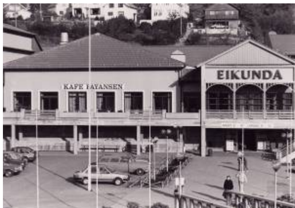
Eikunda 1986.

Eigerøy ble avviklet i 1983 mens filialen på Eie var i drift ut januar 1985.