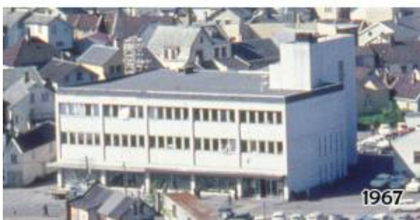
Bygging av Sentrumsgården trinn for trinn.

Etter krigen ble det i flere år arbeidet med planer for et nybygg, men først i 1965 kunne forretningen flyttes over i et første byggetrinn av et nytt varehus som hadde blitt reist på Nytorget , ved siden av bygningen i Jernbanegaten 8. Høsten 1966 ble den gamle bygningen revet og andre byggetrinn av varehuset påbegynt. 28. oktober 1968 kunne så endelig Eikunda åpne et topp moderne varehus sentralt i byen. Bygningen er i dag kjent som Sentrumsgården.