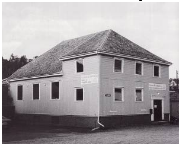
Folkets hus i Spinnerigaten 6 ble bygd av kommunistene i 1931 og ble det siste av i alt tre Folkets hus. Her i 1996.