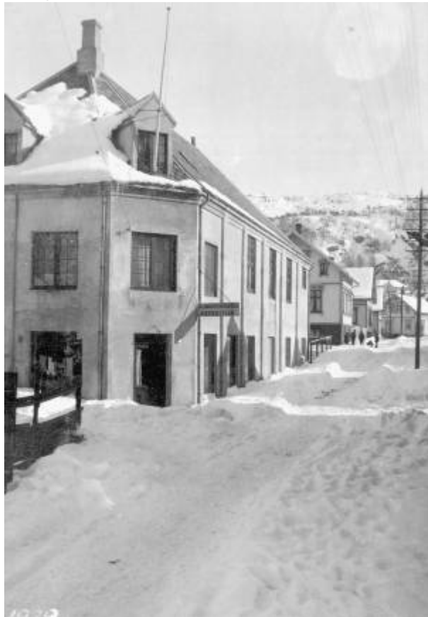
Folkets hus/Festiviteten i Sandakergaten i 1920-åra.