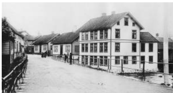
Elvegaten 26 var det første Folkets hus.